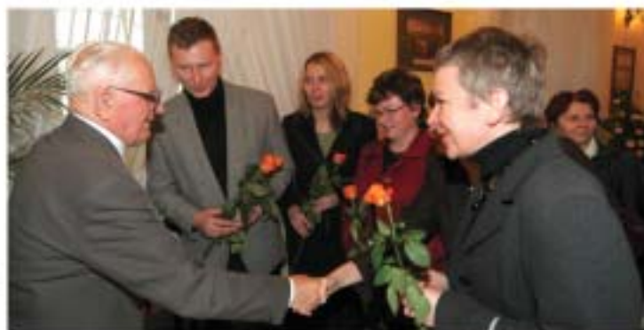
Po uroczystości rodzina i przyjaciele składali Profesorowi Okoniowi życzenia