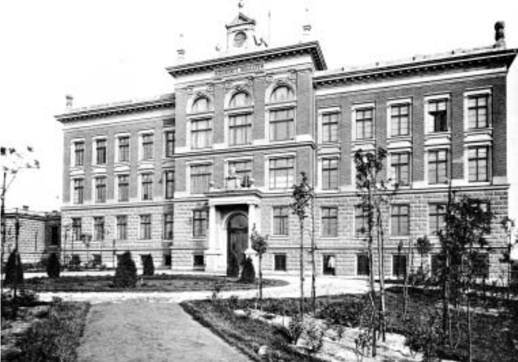
Zdjęcie archiwalne z ok. 1894 roku. Widok od strony nieistniejącego dziś parku

nie posyłałi dzieci do szkoły, póki nie będzie możliwe nauczanie w języku polskim. 31 października 1905 roku przybyło do szkoły zaledwie 87 uczniów, więc szkołę znów zamknięto. Niektórzy uczniowie już nigdy nie powrócili do szkolnej ławy, inni rozpoczęli uczęszczanie na uczniowskie komplety. Rok później właśnie uczniowie z kompletów przeszli do spolszczonej Szkoły Handlowej w Będzinie, a inni rozpoczęli naukę w nowo powstałym Gimnazjum w Sosnowcu zlokalizowanym nad Przemszą.