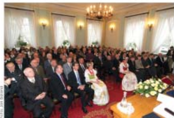
Uroczystość wręczenia dyplomu odbyła się 5 grudnia 2006 roku w sali im. Józefa Brudzińskiego w Pałacu Kazimierzowskim w Warszawie – rektoracie Uniwersytetu Warszawskiego