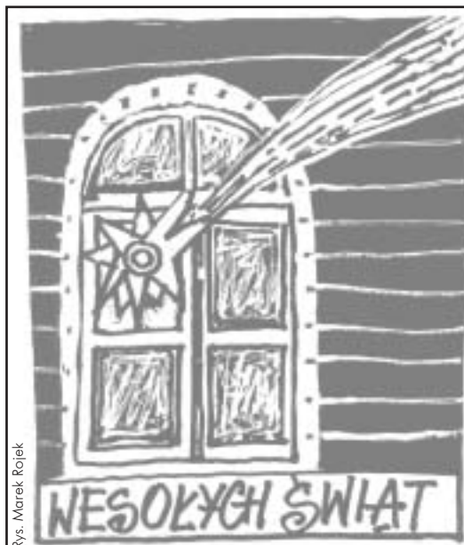
Rys. Marek Rojek

Radosnych, pełnych ciepła i nadziei Świąt Bożego Narodzenia, Pomyślności, satysfakcji i wytrwałości w Nowym 2007 Roku