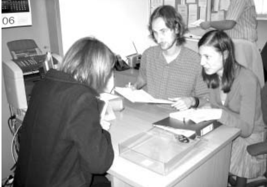
Po poradę trzeba zgłosić się osobiście