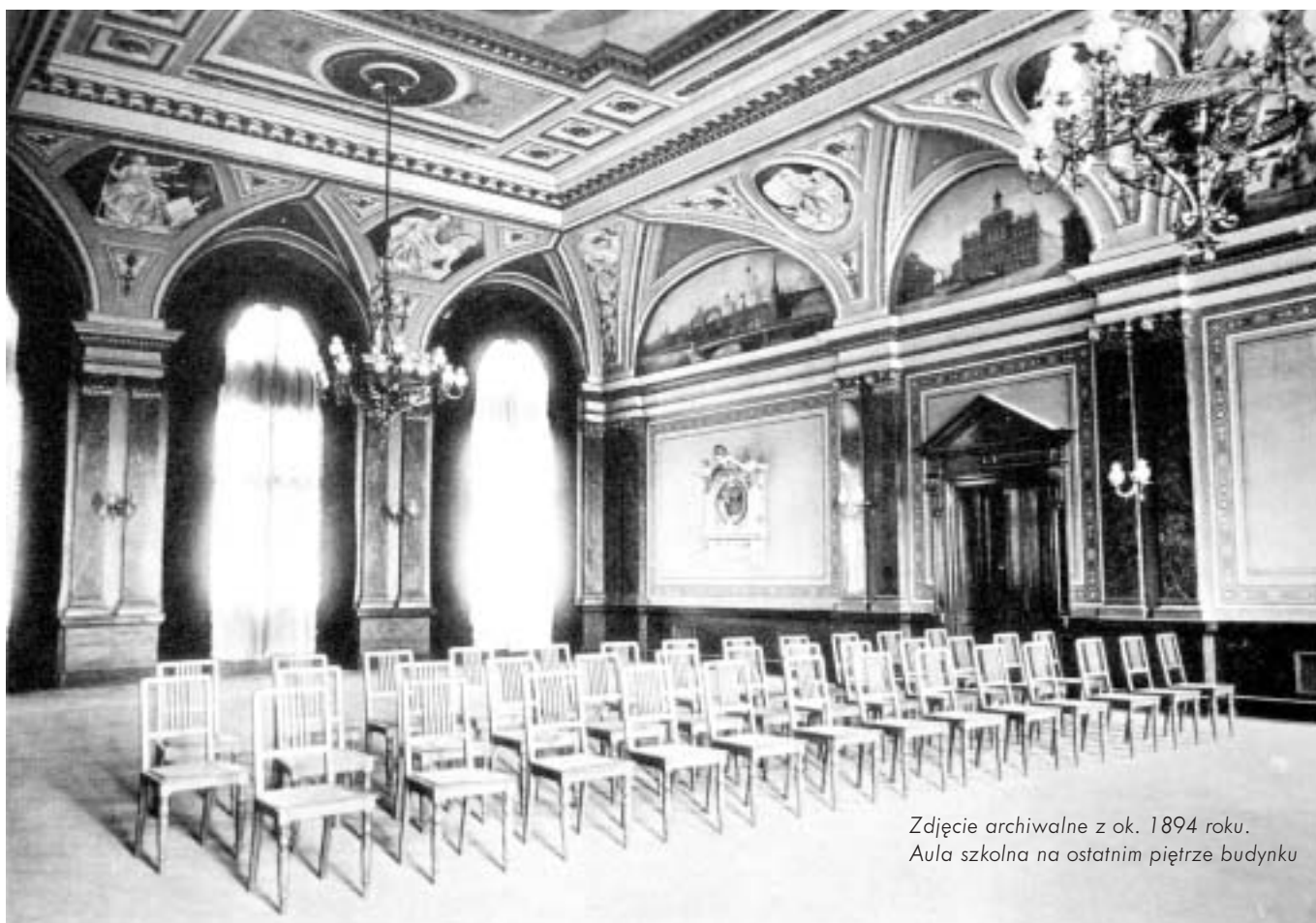
Zdjęcie archiwalne z ok. 1894 roku. Aula szkolna na ostatnim piętrze budynku