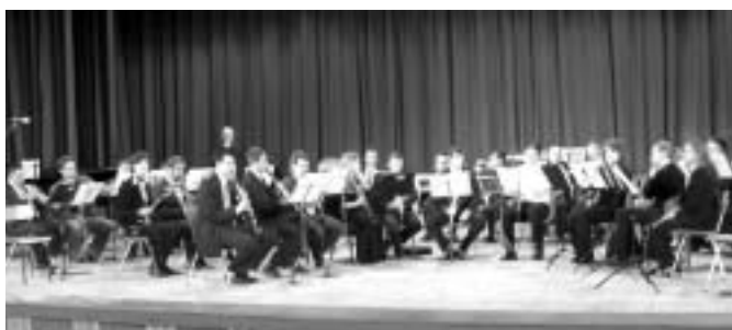
Orkiestra Dęta Instytutu Muzyki

Wydarzeniem muzyczno-naukowym naszej Uczelni była, zorganizowana 25-26 października przez Katedrę Dyrygowania i Dydaktyki Muzycznej Instytutu Muzyki Wydziału Artystycznego w Cieszynie, międzynarodowa konferencja naukowa pt. „Wartości a realizacja i odbiór dzieła muzycznego”. Jej celem była wymiana doświadczeń dyrygentów i nauczycieli